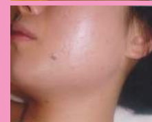
ビバーチェ、再生管理10回後