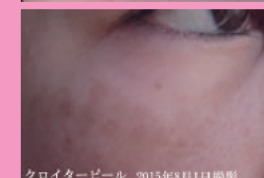
ビバーチェ、再生管理8回後