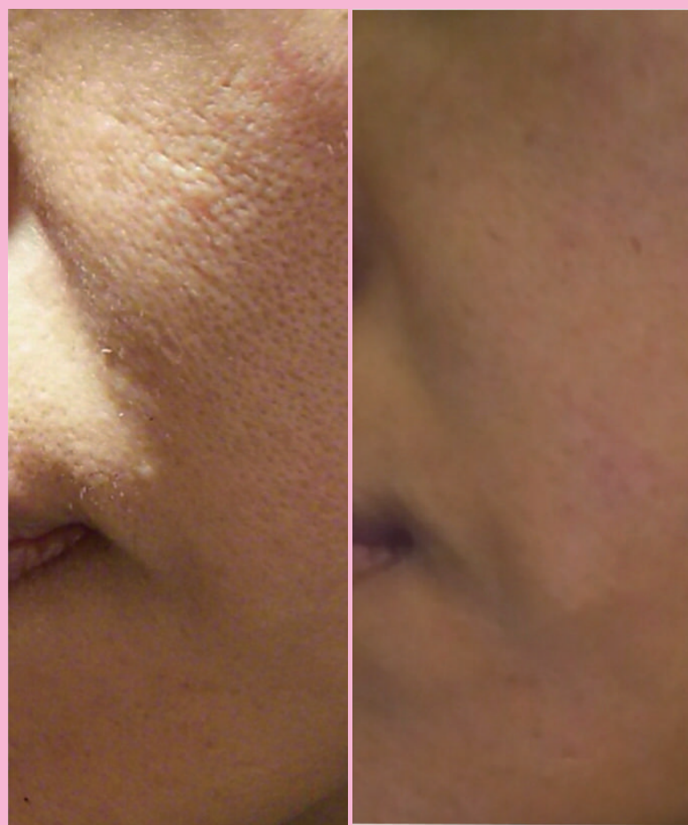
アマービレプラス、再生管理1回後

忙しいけど、しっかり再生したい方必見コース。 天然ハーブで緩やかな剥離を促した後も再生管理 ケアをして、ぷるるん！つや肌へ。